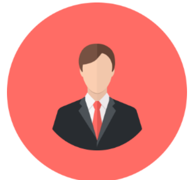
Специалист по интернет-рекламе